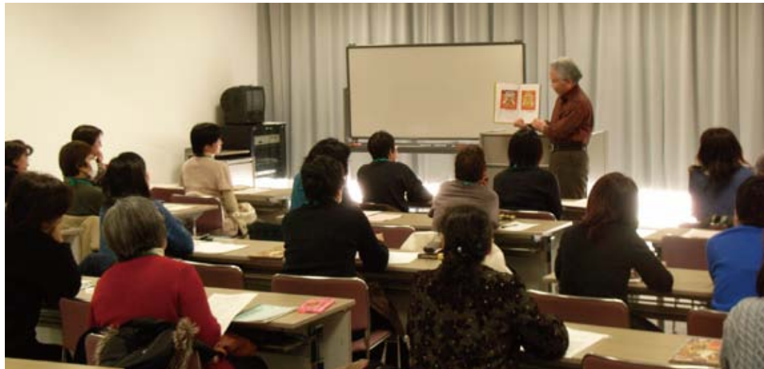
30 人もの受講者が集まって講師の話に耳を傾けていました。(平成 22 年 1 月)

絵本読み聞かせ人材養成講座 は平成八年から三期三年、この 九月で終了します。 講座開始のきっかけは「読み聞