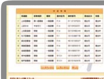
詳細情報(図書)の画面を下にスクロールすると所蔵情報が出てきます。