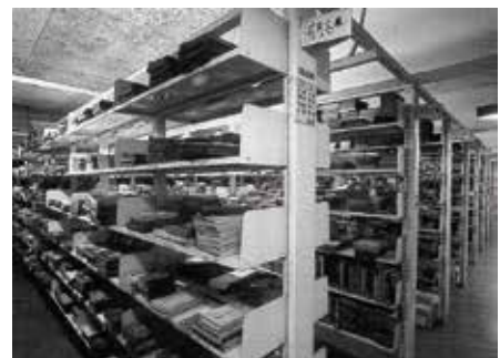
花月文庫が所蔵されている上田図書館の書庫

現在上田図書館に所蔵されているこの本を見せてもらいました。表紙は赤と言うよりオレンジ色に近い印象で、破れも落書きも無く、百年後も寄贈者の愛児は大事に守られていました。